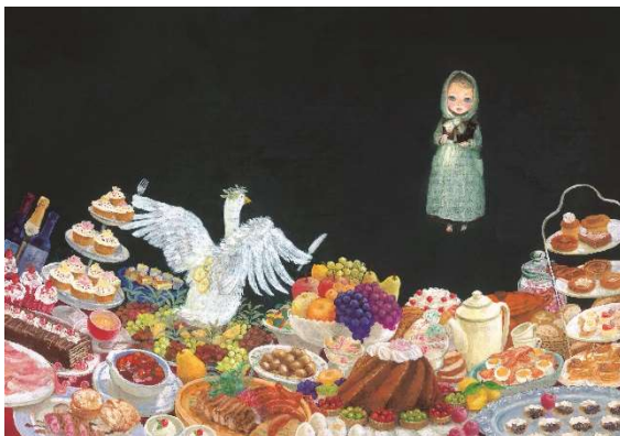
2.『マッチうりのしょうじょ』原画 フレーベル館 (2018年)