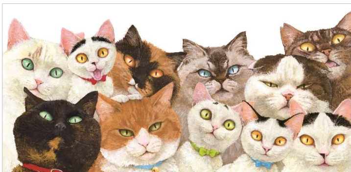
4.『ねことねこ』原画 こくま社 (2019年)