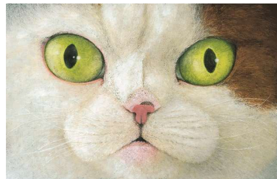
3.『ネコツメのよる』原画 岩崎書店 (2021年 [WAVE出版2016年])