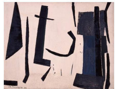
6. 津高和一《声》1956年 油彩、カンヴァス

大阪市生まれ。青年期より詩作の道に入るとともに、大阪の中之島洋画研究所にて学ぶ。戦後は行動美術協会を中心に活動、1952年に同会会員となり、この頃から抽象絵画を制作する。同年に結成された現代美術懇談会(ゲンビ)に参加。その後、国際展への出品を重ね、日本の現代美術を代表する作家となる。1962年から81年まで自宅で「対話のための作品展」を開催したほか、1980年から85年まで夙川沿いでアンデパンダン形式の「架空通信テント美術館」を開催するなど、作品を仲介とした種々のコミュニケーションを試みた。1995年の阪神・淡路大震災で自宅が倒壊、急逝。当館では絵画33点を収蔵。