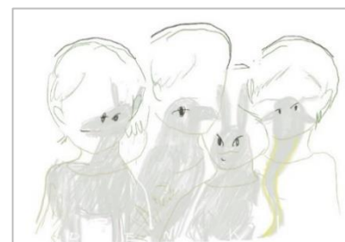
4. 黒田大スケ《4匹》2023年 ドローイング

黒田大スケは、具体美術協会の田中敦子と3名の彫刻家、堀内正和、柳原義達、エミール＝アントワヌ・ブールデルの作品に注目しました。田中は具体美術協会を代表するアーティストの一人として議論や考察が絶えない一方で、アーティスト本人による言葉は多くありません。今回黒田は田中の作品制作をサポートした影の立役者（電気屋）の視点から作品制作を通して田中像に迫ります。あわせて、絵画や平面作品を多く収蔵する当館では展示される機会の少ない彫刻のコレクションに光を当て、堀内正和、柳原義達、ブールデルを演じ、彼らの視点から作品を制作します。全体を通して、田中と彫刻家達についてのばらばらの詩を重ねることで、見えない存在に姿を与えるように透明な何者かの為の物語を紡ぐことを試みます。