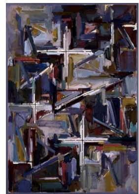
7. 山田正亮《WORK F.1》1990年 油彩、カンヴァス

東京生まれ。東京府立工業高等専門学校を卒業。1949年2月第1回日本アンデパンダン展に出品。1950年から56年まで自由美術家協会展へ出品。初期は静物画を制作、50年代から方形やストライプの組み合わせによる抽象絵画を手掛けた。その歩みは、解体され還元された色彩や形態によって、いかに絵画を成立させるかという探究であり、欧米の近代主義絵画が直面した問題を独自に追及することとなる。ミニマルかつシステムティックに構成された絵画は、「塗る」作業を常に意識させる画面が特徴。やがて、1980年頃より規則的に分割された画面を荒いストロークで塗りつぶす、より表現主義的な作風へと展開した。当館では絵画3点を収蔵。