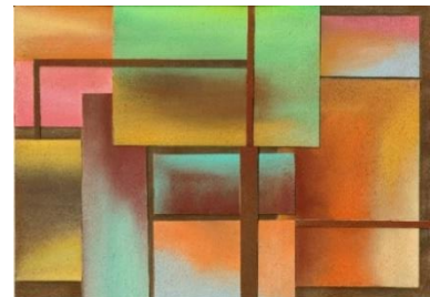
3. 野原万里絵《色彩への扉》2023年 パステル、色鉛筆、紙

野原万里絵は、山田正亮に注目しました。生涯にわたって約5,000点もの絵画作品を遺した山田は、几帳面な性格をもち、近い人にも描く姿を見せなかったといえます。作品と共に残された50冊以上に及ぶ山田の制作ノートには、作品のスケッチや課題に対するメモ、その時に感じたであろう山田の言葉が綴られており、山田の絵画に向かう思考に触れることはできるものの、「絵画を描く」というシンプルな感覚を想像するには、もう一步踏み込んだアプローチが必要です。今回、野原は、山田が「何故描いたのか」「どのように描いていったのだろうか」という本質的な絵画への問いを画家の視点で調査を行い、制作という行為を通して一つの答えを導きます。