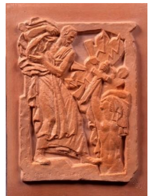
11. エミール=アントワーヌ・ブールデル 《デモステネスA》1927年 テラコッタ

フランス、モンターバン生まれ。家具職人の家に生まれ、トゥールーズの美術学校を経て、1884年パリのエコール・デ・ボザールに進み、ファルギエールに師事するが、学校に失望して退学する。ダルーのアトリエを経てロダンの助手となり、15年間働いた。当初ロマン主義的傾向の情熱的な作品を作ったが、1900年の《アポロンの頭部》によってロダンの影響を離れ、“偉大さ”を目指し近代彫刻に新しい息吹を与えた。代表作としては《ベートーヴェン》の連作、《弓をひくヘーラクレス》、《アルヴェル將軍の記念碑》などが知られる。1929年パリ郊外のル・ヴェジネで逝去。当館では彫刻13点1組を収蔵。