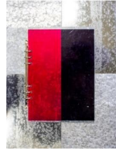
1. 藤本由紀夫《y-memo》2023年 カラーシート、ブリキ、トタン

藤本由紀夫は、山崎つる子の1964年の作品《作品》一点から何が読み取れるかに挑戦します。藤本自身の制作のプロセスと照らし合わせることにより、山崎の仕事の姿勢、思索の跡を追うことが出来ると考えます。具体美術協会という枠を超えて山崎つる子の世界の新しい発見を試みます。