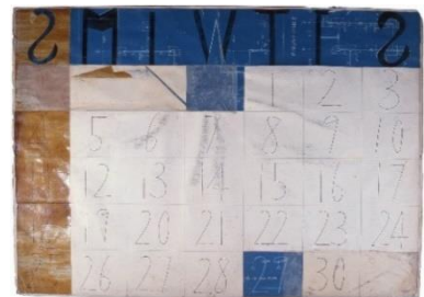
8. 田中敦子《カレンダー》1954年頃 インク、紙、鉛筆、コラージュ

大阪生まれ。京都市立絵画専門学校中退の後、大阪市立美術研究所にて学ぶ。この頃、抽象絵画を描き始める。1954年頃、「0会」に参加する。当時はカレンダーの作品や、数字のみで構成する作品を制作した。1955年に具体美術協会(具体)の会員となった後は、コードで繋がった20個のベルを展示会場に設置し順に鳴り響くようにした作品や、巨大な人型の布に電球を取り付け、規則的に光を点滅させた《舞台服》、多彩な電球を組み合わせ明滅させた《電気服》など先鋭的な作品を発表した。1957年頃から電球とコードの絡まりから着想を得た絵画を描き始める。1965年「具体」退会。その後、国内外で個展を開催するほか、様々な国際展にも出品し、精力的に活動を続けた。当館では絵画15点、立体1点を収蔵。