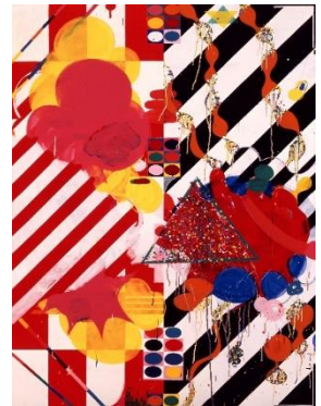
5. 山崎つる子《作品》1964年 ビニール塗料、綿布、板 ©Estate of Tsuruko Yamazaki, courtesy of LADS GALLERY, Osaka

芦屋市生まれ。1948年小林聖心女子学院英専卒業。1954年具体美術協会(具体)の結成に参加、72年の具体解散時まで在籍した。1950年頃より子供を対象とした美術教室に一貫して携わる。1975年AUの結成に参加。1980年代以降、個展を中心に活動。当館では2004年に個展「リフレクション 山崎つる子」を開催。ストライプを基調としたカラフルな抽象画や、ブリキや透明な支持体を使用した作品など、色彩の反映といった視覚性に訴えかける作品を多く残した。当館では絵画・平面5点を収蔵。