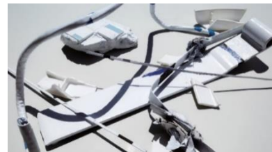
2. 高橋耕平《未定》2023年 インスタレーション（一部）

高橋耕平は、津高和一の詩から始まった書や、絵画制作が抽象絵画へと進むとともに個人の活動を拡張した「運動」とも言える「対話のための作品展」や、社会と芸術を繋ぐ試みとして行った「架空通信テント美術館」など、私と公のつながりを「対話」という形で拡張していった津高の活動に注目しました。本展では仮説として、津高の抽象絵画に向かう姿勢と成り立ちに、後の「対話」的活動の萌芽を見出し、高橋の制作プロセスを重ね、津高が試みた作品と作品が置かれる場を通じた「対話」のあり方の継承を試みます。