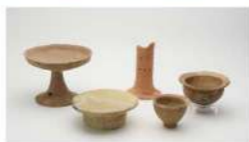
弥生土器(会下山遺跡) 弥生時代

2012年に芦屋市指定文化財に指定された「芦屋川の文化的景観」を持ち、今年で市制80周年を迎えた芦屋市の歴史を、古代・中世・近世・近代それぞれの時代の主要な歴史資料とともにご紹介します。 ※期間中、展示入れ替えあり。