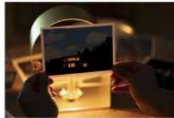
まなびはく2019 星の読書・夏