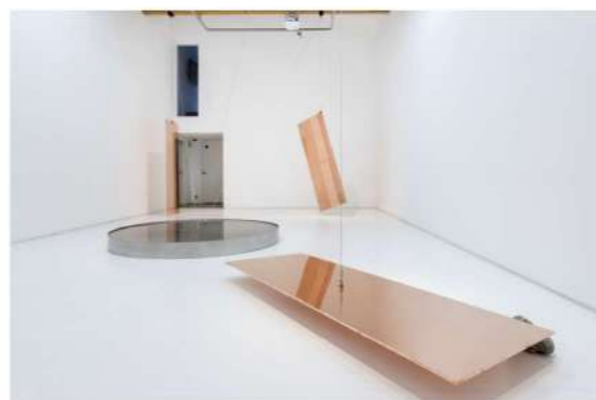
植松奎二《見えない軸・水平・垂直・傾》2019年 参考画像