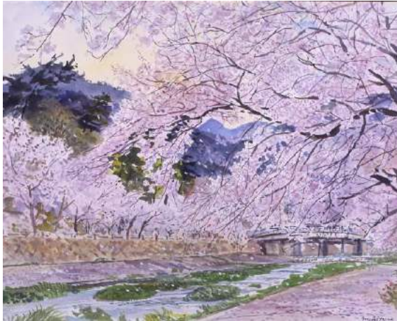
5 《芦屋川》青山政吉画 (昭和 63 (1988) 年)