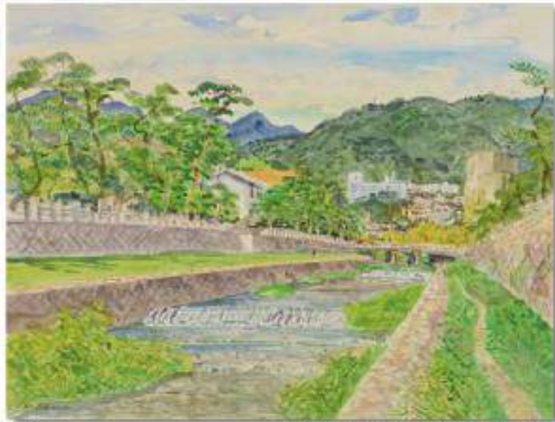
青山政吉「阪神名勝」〔平成21(1990)年〕 芦屋市立美術館蔵