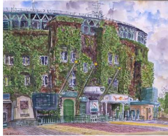
6 《甲子園球場》青山政吉画 (平成 2 (1990) 年)