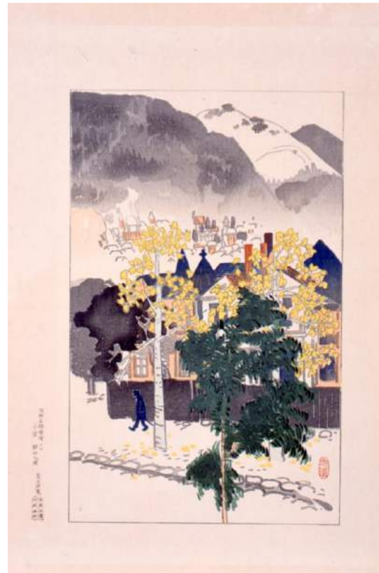
2 阪神名勝図絵 《三の宮》野田九甫画