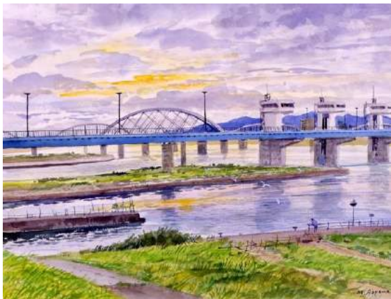
7 《淀川(毛間)》青山政吉画 (昭和 63 (1988) 年)