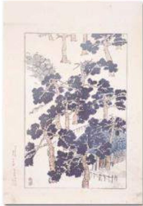
青山政吉「阪神名勝図絵(墨画)」 〔A.1917年〕 芦屋市立美術館蔵