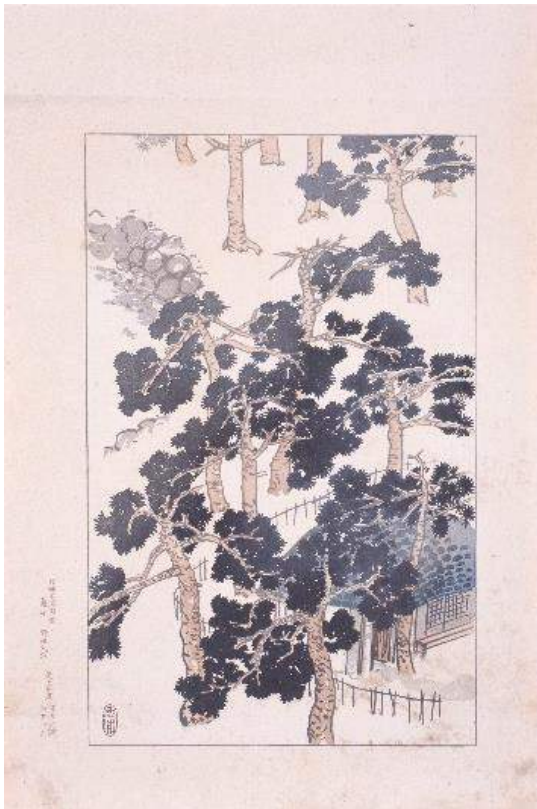
1 阪神名勝図絵 《蘆屋》野田九甫画