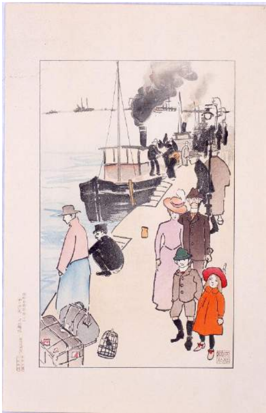
3 阪神名勝図絵 《神戸波止場》赤松麟作画