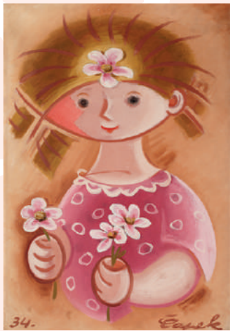
ヨゼフ・チャペック 花を持つ少女 1934年 油彩、カンヴァス 個人蔵、ブラハ