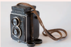
カレルが使用していたカメラ ローライフレックスオリジナル (6×6cm判二眼レフカメラ) ブラハ10区