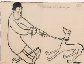
ヨゼフ・チャペック ミンダと散歩するカレル・チャペック 1926-1930年 鉛筆、インク、紙 ブラハ10区