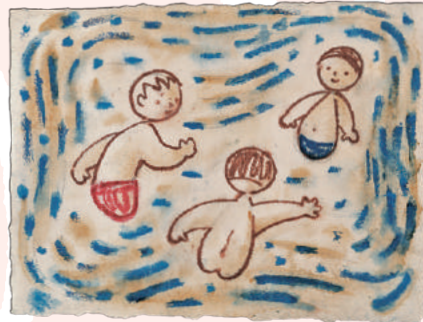
ヨゼフ・チャペック 水浴び 1928-1935年 バステル、紙 個人蔵、ブラハ