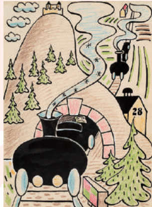
ヨゼフ・チャペック 楽しい川辺 1933年 インク、クレヨン、紙 個人蔵、ブラハ