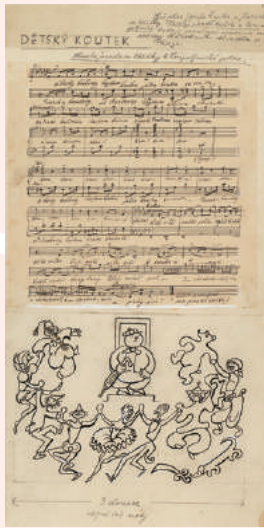
ヨゼフ・チャペック ちちんぷいぷい 1932年 インク、紙 個人蔵、ブラハ