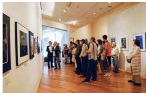
第64回芦屋市展講評会の様子 2017年(参考)

「何人も随意に応募することが出来ます。」という自由さが特色の公募展として、1948年に第1回展が開催されました。第65回を迎える本展は、平面・写真の2部門で構成されます。 今回も多くの方々に親しみを持っていただける公募展をめざします。前回に引き続き、会期中に来場者の投票で選ぶ「オーディエンス賞」も設けます。 主催：芦屋市、芦屋市教育委員会、芦屋市立美術博物館