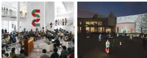
rooms 風景 2016年

国内外で活躍する美術家や音楽家、アーティストの作品とともに当館コレクション作品を展示し、音楽と美術作品をタイムラインに沿って展開します。聴覚や視覚といった感覚の領域にとらわれることのない体験をお楽しみください。2016年3月に開催した美術と音楽の一日「rooms」の最終章となります。