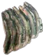
ナウマンゾウの歯の化石 芦有ゲート付近出土 約10万年～3万年前

2012年に芦屋市指定文化財に指定された「芦屋川の文化的景観」が育んできた芦屋の歴史をご覧ください。芦屋の歴史を古代、中世・近世、近代にわけ、それぞれの時代の主要な歴史資料をご紹介します(期間中展示替えがあります)。