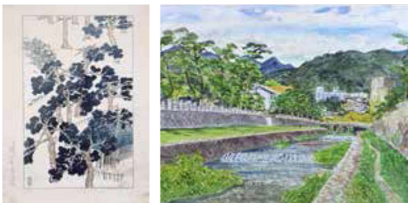
野田九浦 阪神名勝図絵 《蘆屋》1917年