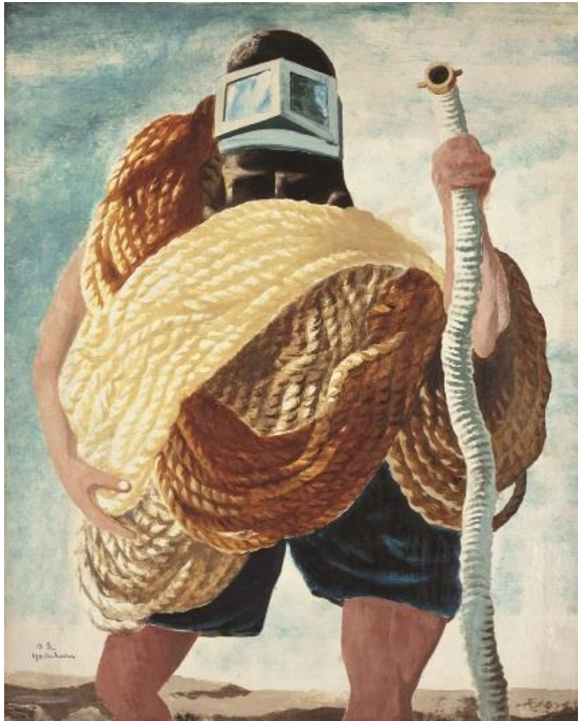
3. 《縄をまとう男》 1931-33年頃 油彩、カンヴァス 大阪新美術館建設準備室蔵

まだ知らなかった美しさにふれることは、 新鮮な生きがいを感じることにおもいませんか？