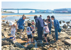
2015年度「MARK IN THE CITY ASHIYA」

現代美術作家と一緒に、美術の面白さ・楽しさ・難しさを発見し、美術に親んでいただく場となるような様々なイベントを開催します。