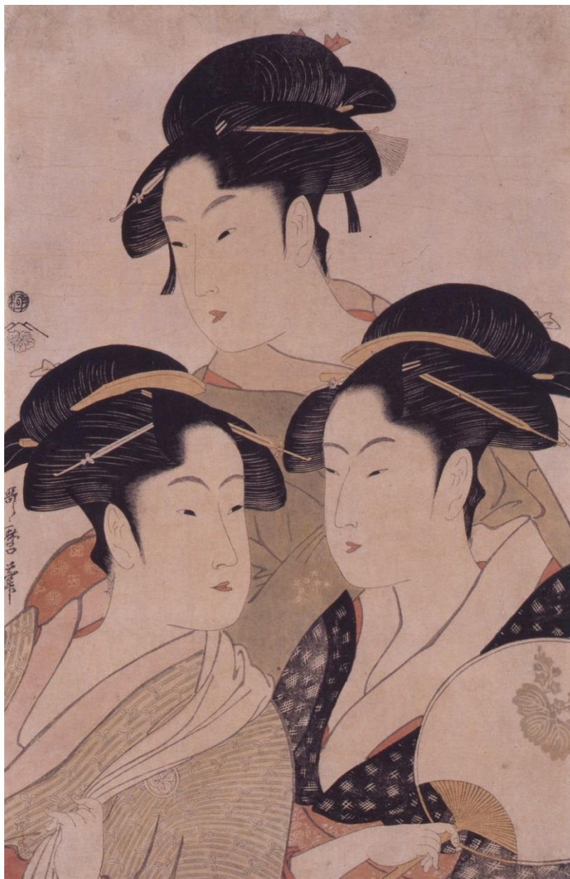
1 | 喜多川歌麿「当時三美人」寛政2(1790)-文化元(1804)年 和泉市久保惣記念美術館蔵 展示: 第2期(9月8日(火)~10月4日(日))