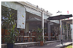
喫茶カフェ・ド・ルポ