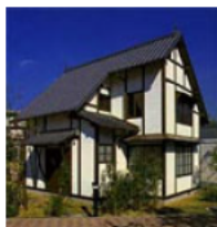
小出権重アトリエ