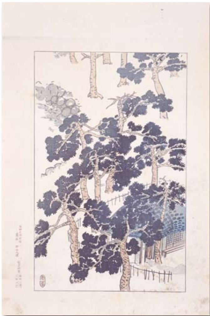
野田九甫 阪神名勝図絵《芦屋》 (大正6(1917)年) 芦屋市立美術博物館蔵